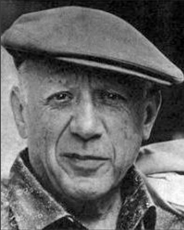
Пабло Пікассо. 1907 року став засновником кубізму.