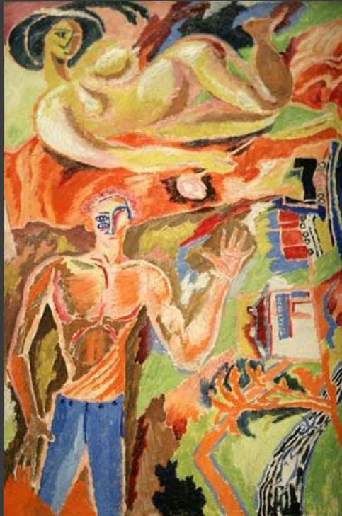
Д. Бурлюк – «Портрет поета Каменьського»