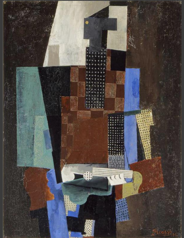
Пабло Пікассо – «Гітарист» (1916 р.)