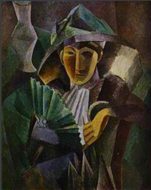
«Жінка з віялом» (П. Пікассо, 1909 р.)