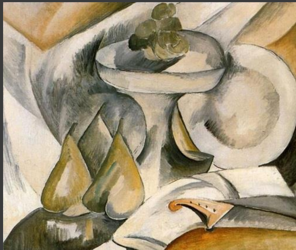
«Тарілка і блюдо з фруктами» (Жорж Брак, 1908 р.)