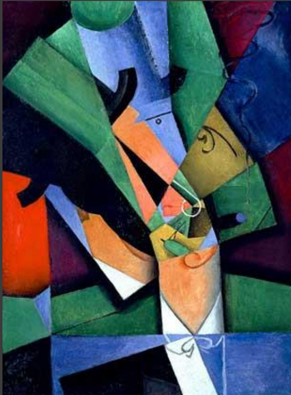
Хуан Гріс – «Курильщик» (1913 р.)