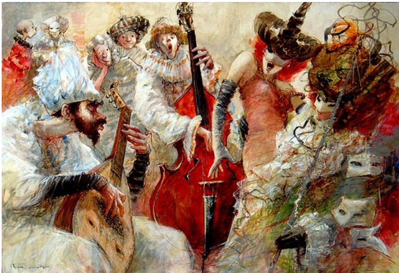
Марсель Ніно Пажо