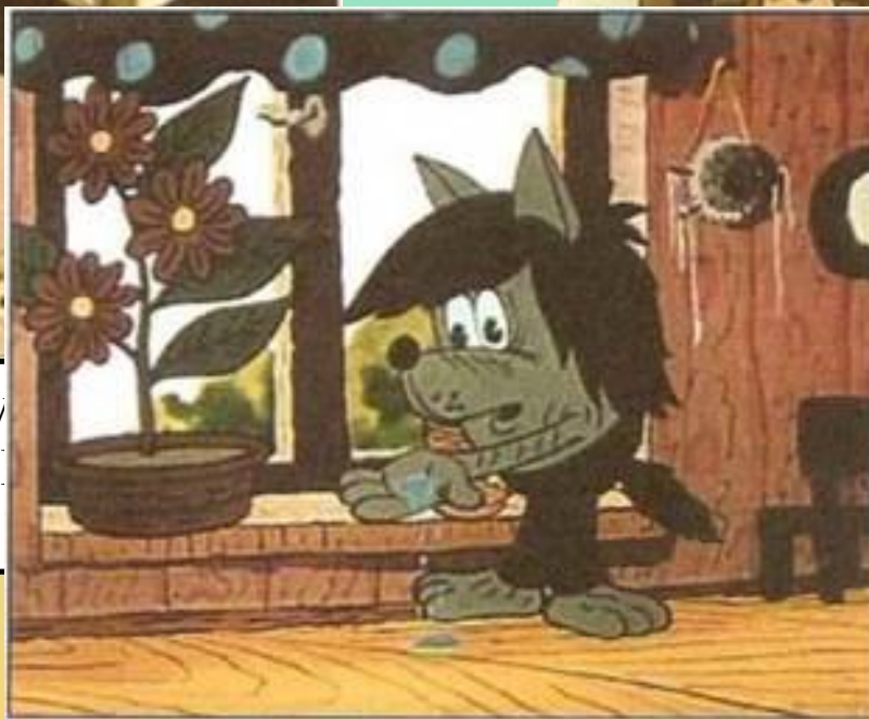
Кадр із фільму «Повертайся, Капітошко!» (реж. Б. Храневич)