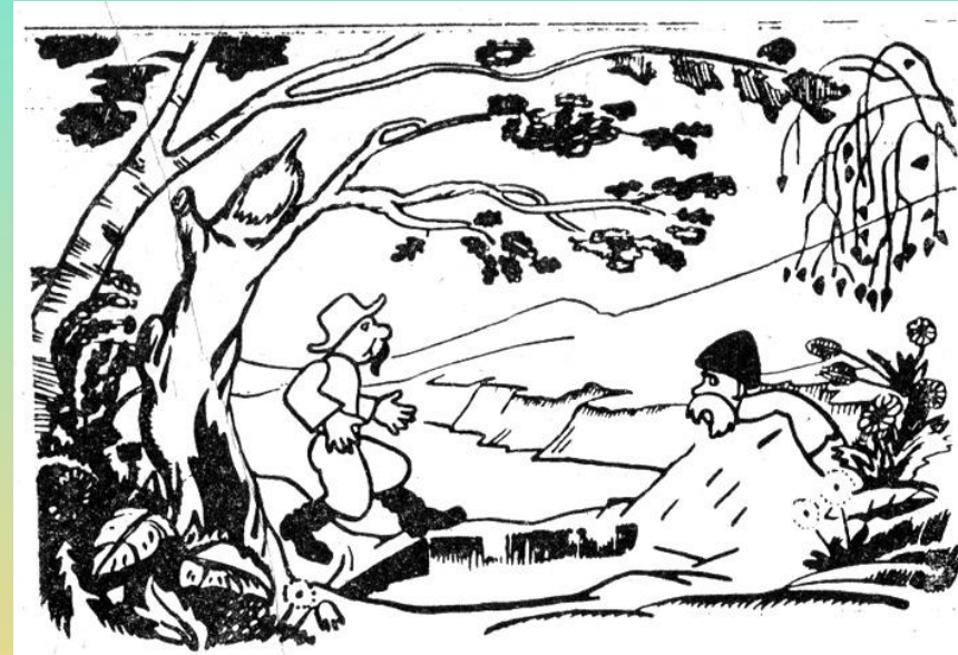
Кадр з мультфільму «Українізація» Левандовського