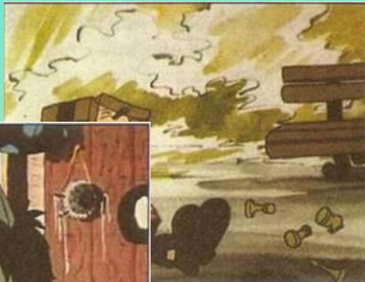
Кадр із фільму «Парасолька стає ...» (реж. В. Дахно)