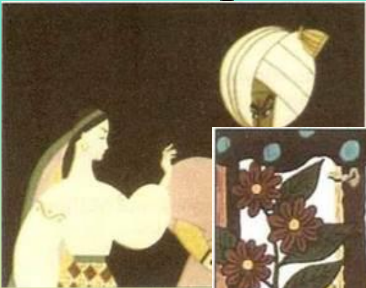
Кадр із фільму «Богуславка» (реж. ...)