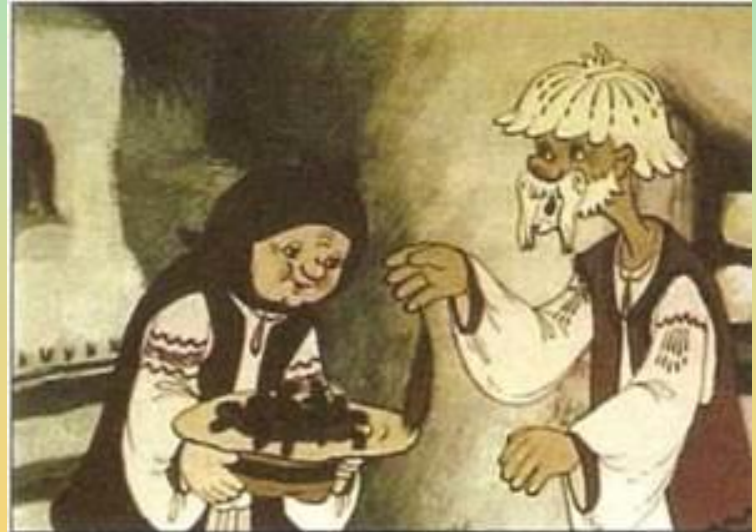
Кадр із фільму «Кривенька качечка»