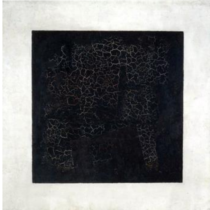
К.Малевич: Чорний квадрат

З модернізмом авангард пов'язує неприйняття реалізму, для модернізму характерне вибірково критичне ставлення до традицій, авангард – в опозиції до минулого.