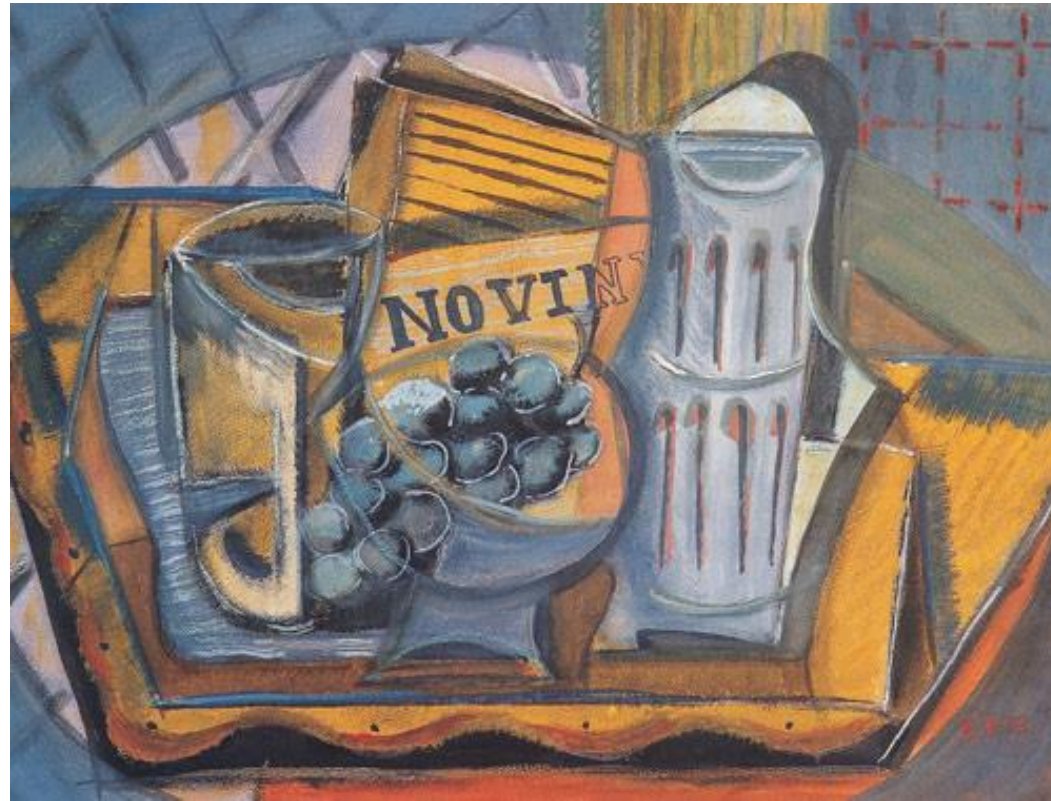
Е.Шимерова: Натюрморт з газетою

Модернізм став справжньою художньою революцією і міг пишатися такими епохальними відкриттями в літературі, як внутрішній монолог та зображення людської психіки у формі "потoku свідомості", відкриттям далеких асоціацій, теорії багатоголосся, універсалізації конкретного художнього прийому і перетворення його на загальний естетичний принцип, збагачення художньої творчості через відкриття прихованого змісту життєвих явищ, відкриттям ірреального та непізнаного.