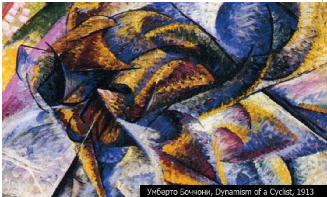
Умберто Боччони, Dynamism of a Cyclist , 1913