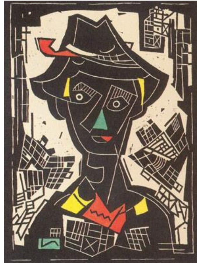
Л.Фулла: Хлопець в капелюсі

Виник у Франції наприкінці ХІХ ст. (Бодлер, Верлен, А.Рембо) і поширився в Європі, Росії, Україні.