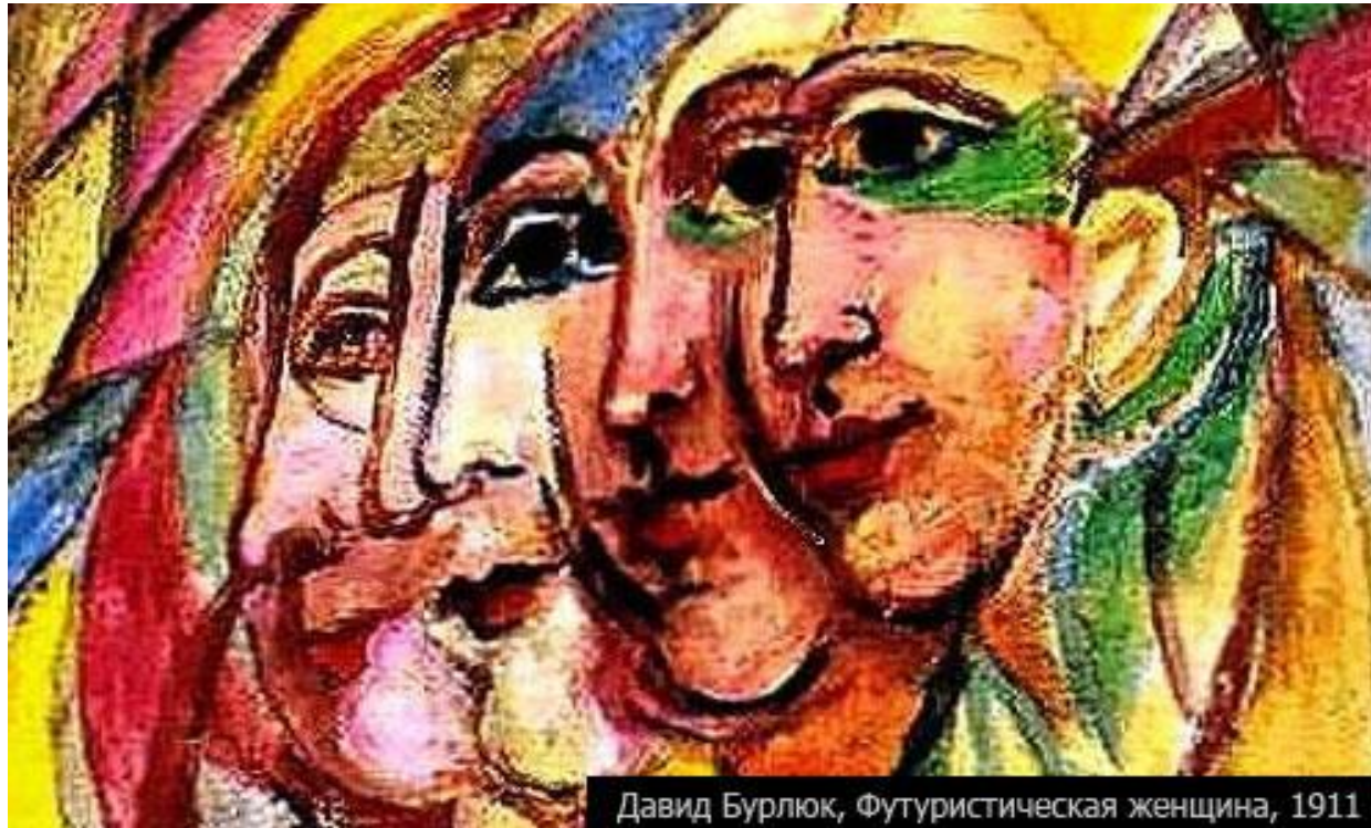
Давид Бурлюк, Футуристическая женщина, 1911

Футуристи виступали проти літературних традицій, вони закликали знищити музеї і бібліотеки, звільнити Італію від гангрени професорів і археологів; старій культурі, яка, за їх словами, оспівувала лінощі думки й бездіяльність, футуристи протиставили нову, що возвеличувала зухвалий натиск, стройовий крок, небезпечний стрибок, ляпас і мордобій.